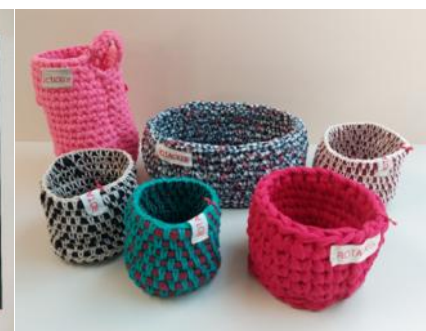
Körbe aus Textilstrick: ab CHF 6.00

Diese Produkte (teils Einzelstücke) können bei Frau Evers per E-Mail ( evers@werkstattrotacker.ch ) oder telefonisch unter 044 878 30 55 bestellt werden.