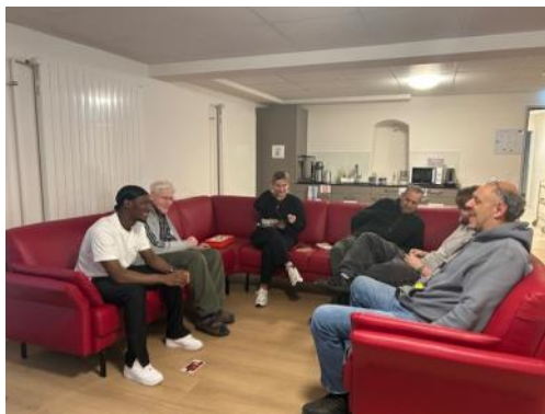
Das neue Sofa wird ausgiebig getestet