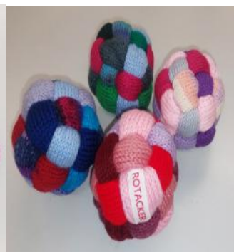
Antistressball: CHF 13.00