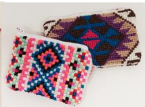
Handyhülle: CHF 10.00