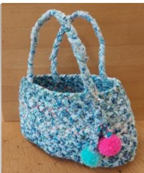
Tasche aus Stoffkordeln: CHF 36.00