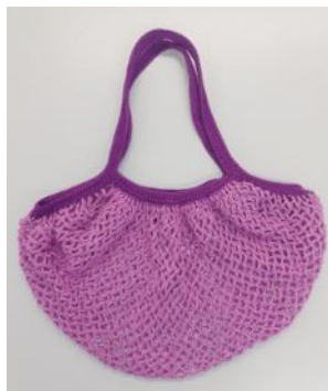
Netztasche aus Garn CHF 18.00