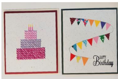
Gestickte Torten-Geburtskarte: CHF 6.00