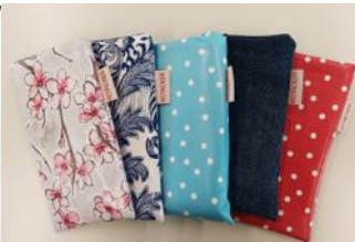
Handyhülle: CHF 10.00