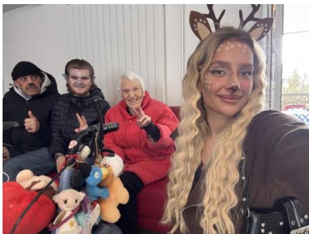
Parat für die Fasnacht und den Fasnachtsumzug