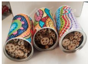
Insektenhotel: CHF 16.00