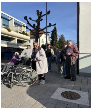
Die ersten Sonnenstrahlen genießen